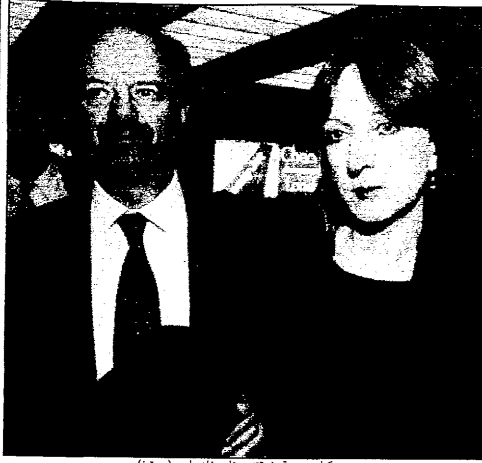
روبن كوك بصحبة عشيقته جينارديانا (روينز)

لندن - القدس العربي: انفردت صحيفة «اندبندنت» البريطانية أمس بخبر الانجاز الذي حققه فريق من العلماء البريطانيين في استنساخ البشرى في بريطانيا لأول مرة. وقالت الصحيفة ان فريقاً من العلماء البريطانيين استطاعوا ان يخلقوا أول جنين بشري من خلايا بويضة واحدة وخلايا من نسيج الجنين. وقالت الصحيفة ان فريقاً من العلماء البريطانيين استطاعوا ان يخلقوا أول جنين بشري من خلايا بويضة واحدة وخلايا من نسيج الجنين. وقالت الصحيفة ان فريقاً من العلماء البريطانيين استطاعوا ان يخلقوا أول جنين بشري من خلايا بويضة واحدة وخلايا من نسيج الجنين.